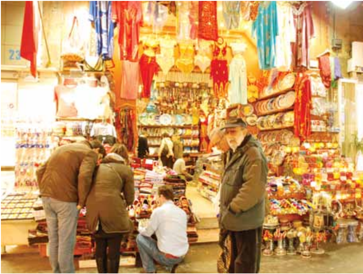
Esnaflar, ürünlerini rengarenk bir dünyada beğeniye sunuyor ve tarihi çarşıdaki hoş sohbetleriyle müşterilerinin alışverişlerini, keyifli hale getiriyor.

anlayabilen esnaf azaldı. Bu durum ilişkilerin zayıflamasına neden oluyor. Her gün gördüğümüz insanlarla böyle bir çekişme yaşamak tuhaf gelse de biz artık buna alıştık.