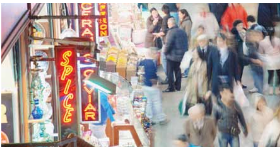
Mısır Çarşısında hayat akşam saatlerinde de tüm hızıyla devam ediyor.

Tarihten birçok izi hemen hemen her semtine sindiren İstanbul'da, bir sabah kendimi evde oturmanın vermiş olduğu kasvetli havayla dışarı attım. Dışardaki hava ise bu duruma direnircesine bana tam aksini söylüyordu. Güneş bana göz kırparken, neredeyse bütün İstanbul halkı, o güzel havada 'iyi ki bu şehirde yaşıyorum' dermişcesine sokaklarda yeni yerler keşfetmenin heyecanı içersinde dolaşıyorlardı. Bu heyecana ben de tanıklık etmek istedim ama evden çıktığımdan beri bir şeyler yemediğimi farkettim. Deniz kıyısında yürürken, birden canım balık ekmeğe çekti; yarım ekmeğe içinde bol yeşillik ve soğanla servis edilen kızarmış balığın kokusu sanki burnumda, tadı da damağımdaymış da kaçırmak istemiyor muşum gibi hızlı adımlarla iskeleye yönelip bu ziyafeti en iyi biçimde bana sunacak