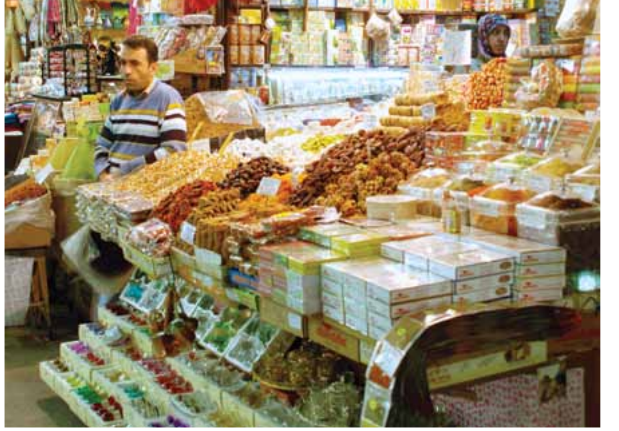
Hem göze hem de damak tadına hitap eden kuruyemişler Mısır Çarşısı'ndaki tezgâhların vazgeçilmez ürünlerindendir.

Eski esnaflar daha güler yüzlüydü, kendileri hariç karşı taraftaki esnafı da düşünürlerdi. Şimdi ise her şey rekabete, maddiyata döndü; birbirini