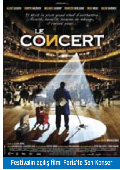
Festivalin açılış filmi Paris'te Son Konser

yabancı filmlerden oluşan bir seçki olan "İstanbul: İçeriden ve Dışarıdan"; hayatın ciddiye alınmayacak kadar kısa olduğu teması üzerinde yoğunlaşan ve güldürü içerikli seçkin filmlerin