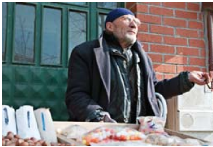
"Cebimde inan ki beş altı lira para ya var ya yok"